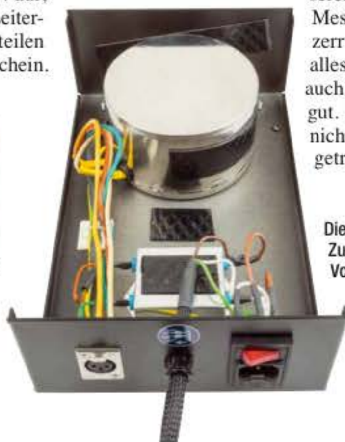
Dieser mächtige, ausgelagerte Zusatztrafo versorgt die sensible Vorstufe mit Strom