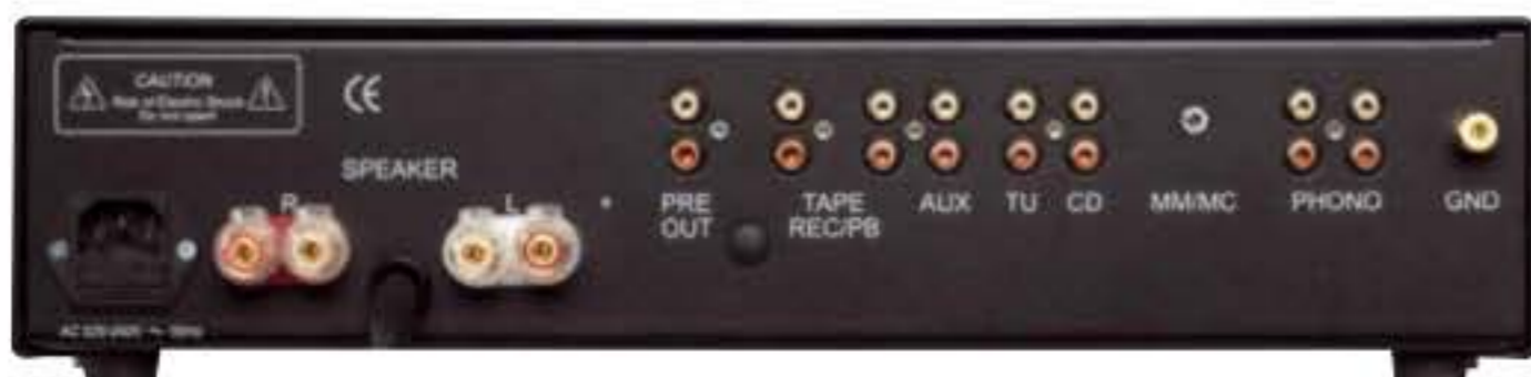
Spartanische, aber alltagskonforme Ausstattung mit sehr hochwertigen Anschlussklemmen und einer Phono-MM/MC-Vorstufe

Praxis Satte Leistung von knapp 2 x 190 Watt an 4 Ohm liefert der RG 10 MK4 an unseren Lastwiderständen im Messlabor. Rauschen, Verzerrungen Dämpfungsfaktor alles mehr als O.K., wenn auch nicht gerade sensationell gut. Denn dieser Verstärker ist nicht auf reine Messtechnik getrimmt, sondern auf Musik.