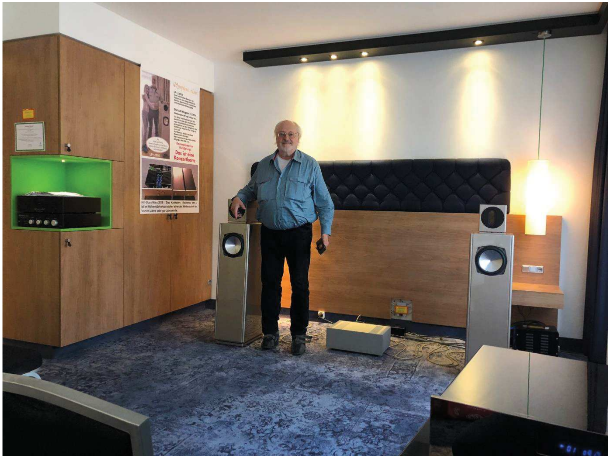
Messe Stuttgart im Jahr 2018